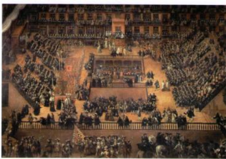
Auto de fe , pintado por Francisco Ricci en 1683. Una escena en la Plaza Mayor durante la Inquisición.